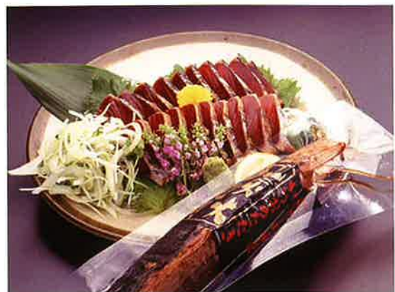
紀州備長炭を使った炭焼き、ワラ焼きの香ばしさと地元産のゆずをふんだんに使ったゆずタレのハーモニー

マリン・エコラベル・ジャパン (MEL ジャパン) は、水産資源と海にやさしい漁業を応援する制度として2007年12月に発足しました。この制度は、資源と生態系の保護に積極的に取り組んでいる漁業を認証し、その製品に水産エコラベルをつけることにより、このような漁業を奨励・促進する制度です。当協会は MEL ジャパンの審査機関です。認証取得についてのお問い合わせは、事業部までお願いいたします。