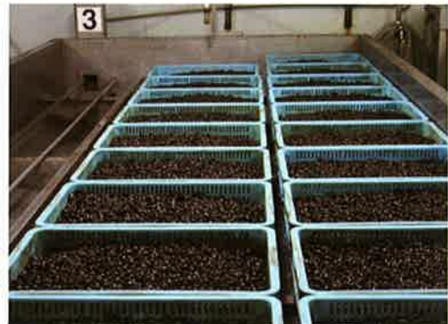
砂抜き処理をして衛生的な環境の中で密封、冷凍