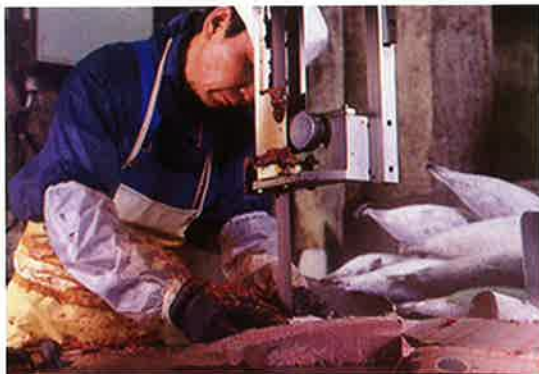
加工風景 1 ロイン加工