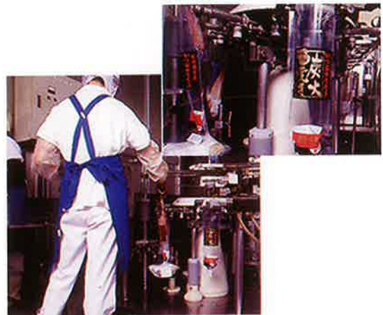
加工風景 3 焼き上がり真空パック