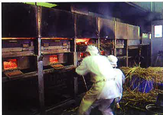
加工風景 2 ワラ焼きの工程