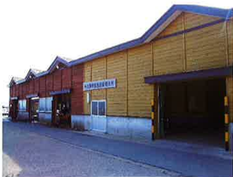
十三漁業協同組合市場

有限会社コクヨーがマリン・エコラベル・ジャパンから 認証されました。認証された内容は次のとおりです。