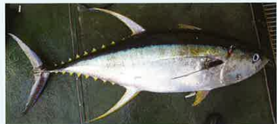
キハダ(太平洋中・東部海域 体長130cm) 『倭名類聚鈔』の「鮪…一名 黄類魚」は本種か