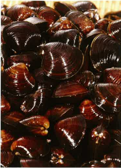
十三湖産ヤマトシジミ