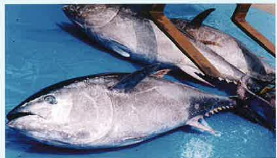
クロマグロ(三陸東方沖) 『本朝食鑑』の「真黒」は本種か

参考資料 岩井 保・中村 泉・松原喜代松(1965)『マグロ類の分類学的研究』京都大学みさき臨海研究所特別報告第2号, 1-51頁 人見必大(1697)『本朝食鑑』[島田勇雄訳註, 1980, 平凡社] 松岡静雄(1937)『日本古語大辞典』刀江書院 源 順(934)『倭名類聚鈔』国会図書館 KF 4-37 武藤文人(2013)『日本における鮪のマグロ類への比定の歴史』東海大学紀要海洋学部「海—自然と文化」第10巻第3号, 11-20頁