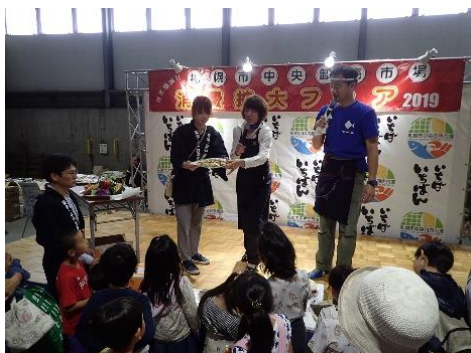
ステージイベント（札幌市）