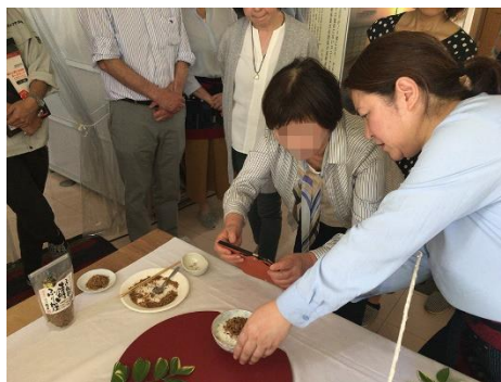
実技講習の様子(佐賀市)