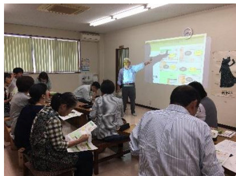
講演の様子(佐賀市)