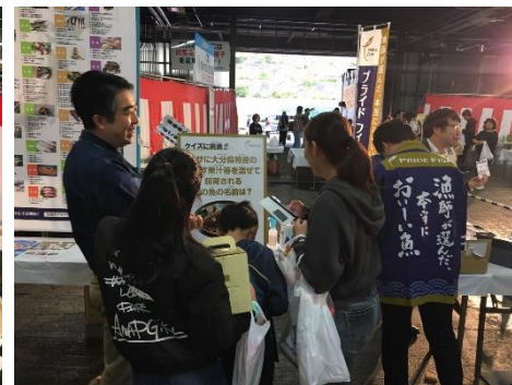
プライドフィッシュとFish-1グランプリPR（静岡市）