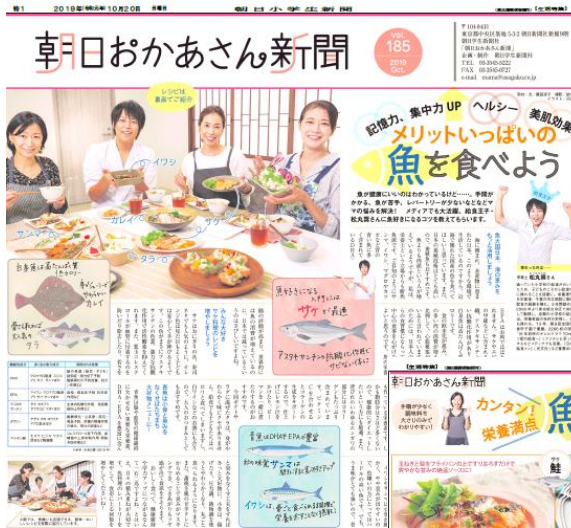
朝日おかあさん新聞 2019年10月20日号表・裏