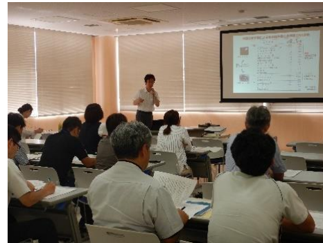
研修会の様子（新潟市）