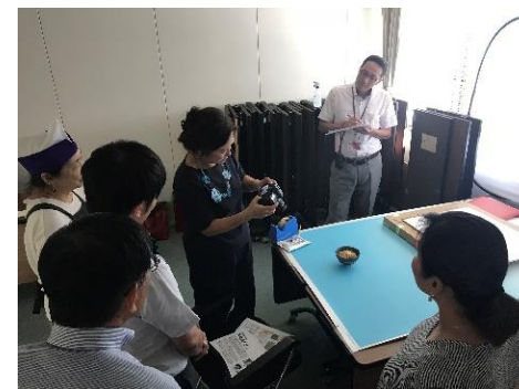
実技講習の様子(宮崎市)