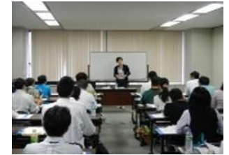
【加工・流通業者等へのセミナー開催】