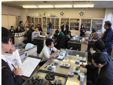
研修会の様子（金沢市）