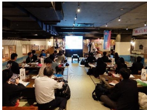
研修会の様子（大阪市）