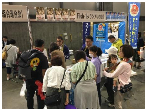
プライドフィッシュとFish-1グランプリPR（札幌市）