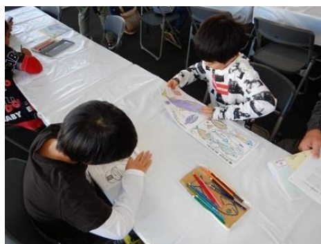
おさかなぬり絵（大阪市）