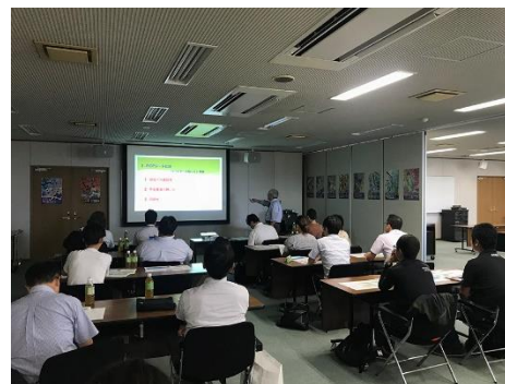
講演の様子(宮崎市)