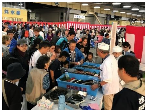
静岡県産の魚介類を展示（静岡市）