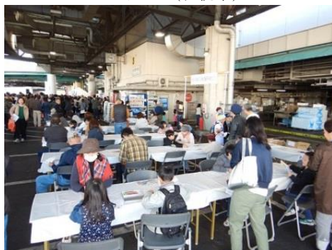
会場の様子（大阪市）