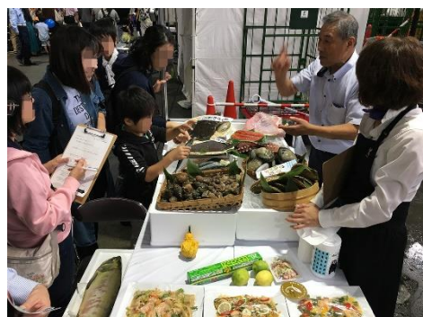
北海道産の魚介類を展示（札幌市）