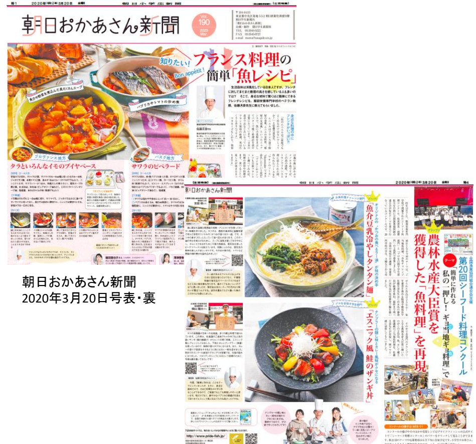
朝日おかあさん新聞 2020年3月20日号表・裏