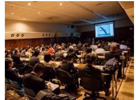
研修会の様子（港区）